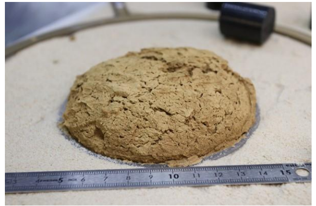
Bahna, které mají v sobě málo vody a jsou tedy velice hustá, v podstatě nedovolují vznikajícím bublinám vodní páry. Proto se jejich objem po vystavení sníženému atmosférickému tlaku dramaticky zvětší. Výsledkem může být útvar, který na první pohled sice vypadá jako sušenka, ale ve skutečnosti jde o bahnitý blob ze zmrzlé krusty a s kapalným nitrem plným velkých bublin.